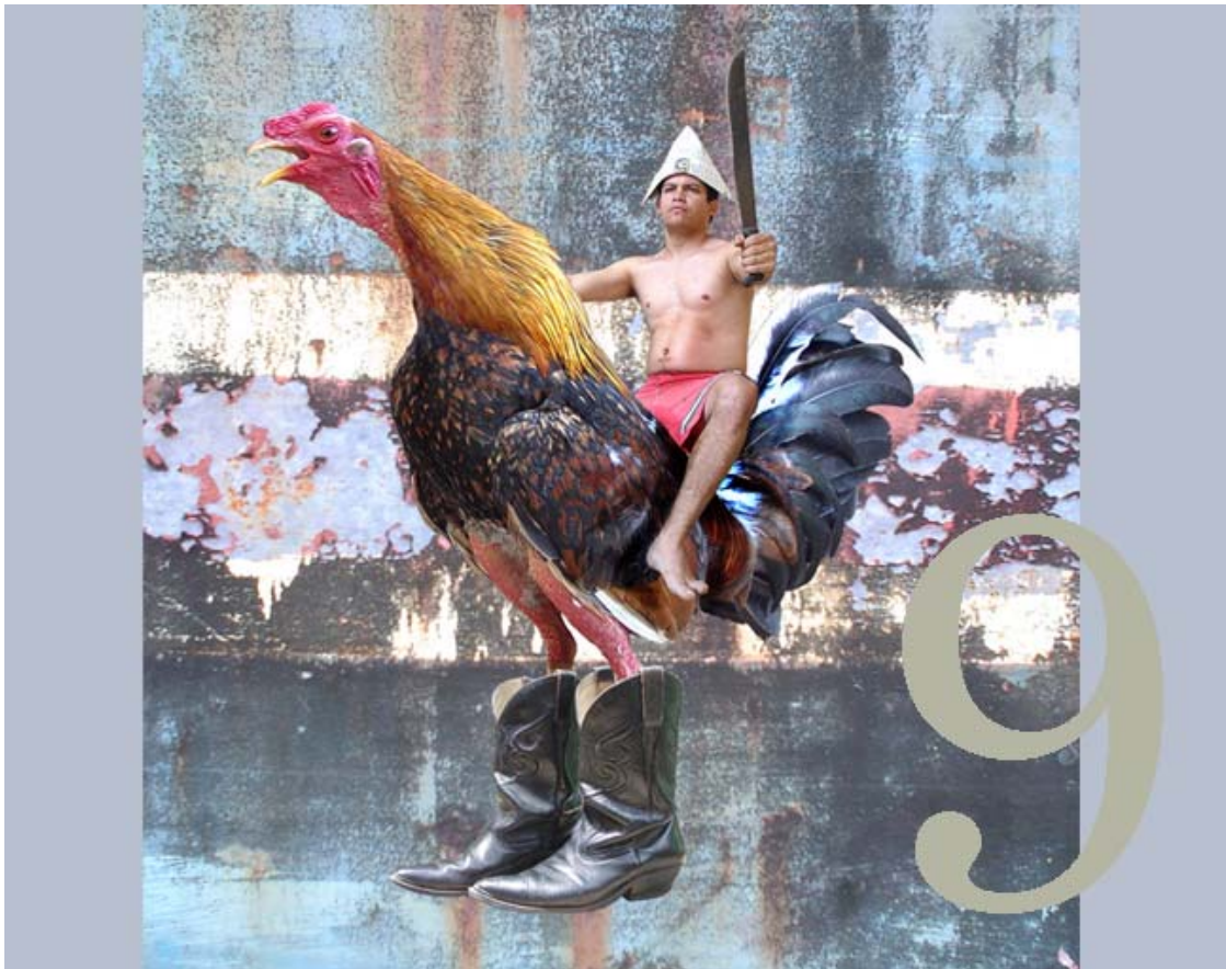
Monumento del gallo pinto , 2006 por Víctor Agüero Gutiérrez, (n. Limón, Costa Rica, 1979 - ) fotografía digital; 86.5 cm x 101.8 cm

EXPOSICIÓN ORGANIZADA CON LA COLABORACIÓN DE LA FUNDACIÓN MUSEOS DEL BANCO CENTRAL DE COSTA RICA