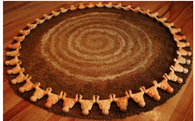
La primera comunión , 2006 por Tamara Ávalos León (n. San José, Costa Rica, 1975 - ) instalación con 45 figuritas, 20 x 17 cm cada una, colocadas en un círculo de 2,70 m de diámetro; cerámica con engobe de arcilla, pulida y horneada en baja temperatura, a través de reducción de calor