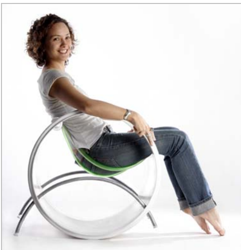
Mecedora , 2004 por Paco Cervilla Cartín (n. San José, Costa Rica, 1977 - ) materiales reciclados: tubos PVC (plástico), tubos plásticos, tubos metálicos, y resortes; 0,72 x 0,60 x 0,80 m